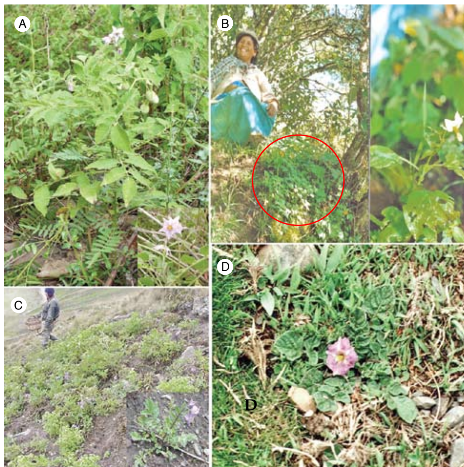
Fig. 2: Especies silvestres de papa con denominaciones nativas de origen Quechua y Aymara. A: (Quechua) Qu'ipa Papa o Yuthu Papa ( S. berthaultii ) en su localidad tipo-Cerro San Pedro-Cochabamba; B: (Aymara) Población (circulo rojo) de plántulas de Monte Cho'gue o Monte Phureja ( S. circaeifolium ) (lado derecha: flor característica de S. circaeifolium ) en su localidad tipo-Monte Iminapi o Laripata-Sorata-La Paz; C: (Aymara) Apharuma o Khaparu Ch'ogue ( S. acaule ) en el Altiplano-La Paz; D: (Aymara) Campo de cultivo de oca ( Oxalis tuberosa ) donde se encuentra como maleza Achachil Ch'ogue ( S. achacachense ) (Recuadro espécimen tipo) en su localidad tipo-La Apacheta-La Paz.

y tienen tubérculos también grandes (e.g. Solanum berthaultii y S. boliviense ) (Fig. 2A); y los restantes nombres, Yuthu Papa , Alcco Papa y Papa de zorro se encuentran relacionados a animales que normalmente se alimentan de los tubérculos de la especie (e.g. S. berthaultii , S.